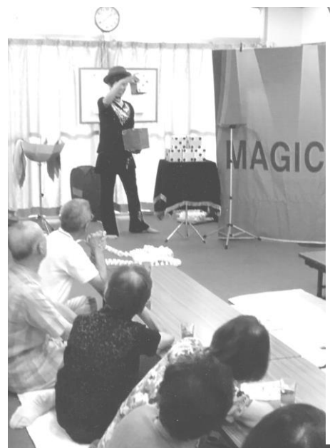
地域のお年寄りを「不思議の世界」へ招待