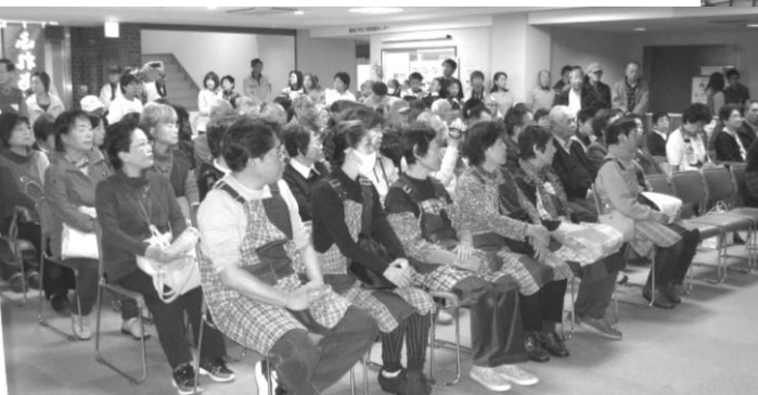
← 舞台上で繰り広げられる歌や踊りに見入る皆さん=「コーラス、踊りやコントなどが次々に演じられて、思いっきり楽しみました」との声も。