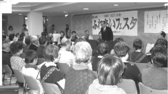
↑ 会場いっぱいの参加者によって始まった開会式