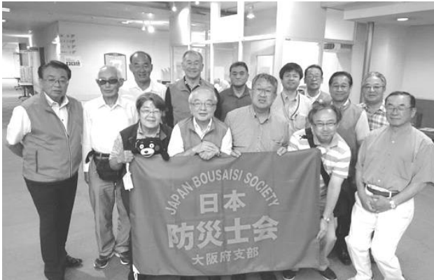
被災に関しての頼もしい味方、当市 防災士会会員

地域防災力の支援活動や学校教育現場での防災アドバイザーとしての連携や災害時公的支援到着までの被害拡大軽減活動の実施。