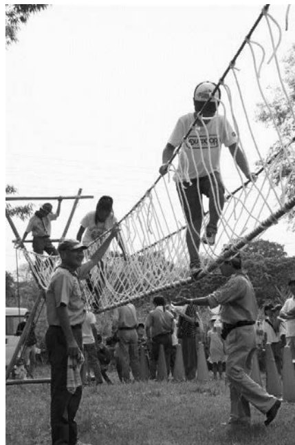
野外活動Ⅱロープ渡りに挑戦する団員

会場において、子どもチャレンジコーナーでモンキーブリッジ・チャレンジ免許証の作成を行います。