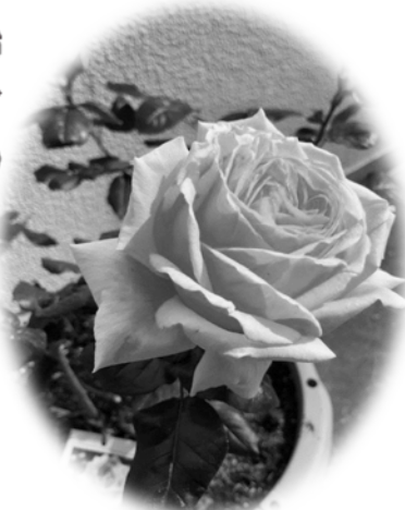
昨年市から預かった「平和のばら」が見事に開花！=品種ピース