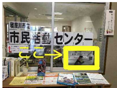
落とし物コーナー