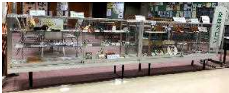
なかまの広場 (エレベーター前のショーケース)

ここは市民活動センターの登録団体が日頃の活動の紹介や手作り品を展示する情報コーナーです。