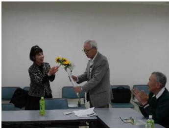
古賀代表から花束贈呈

市民活動センターは最近では活動量も増加の傾向にあり、次のステップへの躍進を見据え、さらなる活動を祈ります。本当に有り難うございました