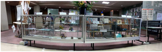
なかまの広場 (エレベーター前のショーケース)

ここは市民活動センターの登録団体が日頃の活動の紹介や手作り作品を展示する情報コーナーです。1月1日から新たに下記の4団体が展示します。