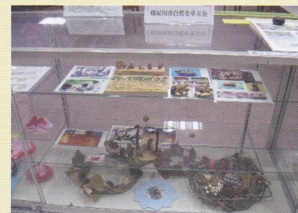
寝屋川市 自然を学ぶ会①