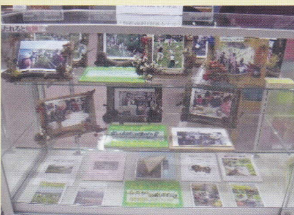
寝屋川市 自然を学ぶ会②