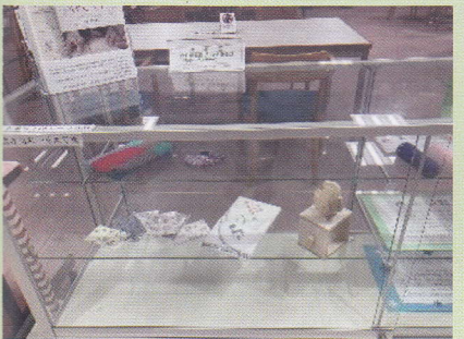
社会福祉法人 讀良福祉会 ワークセンター小路