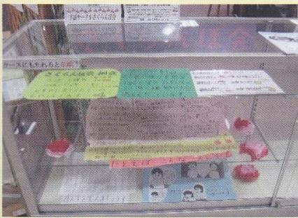
手話サークル さくらんぼ会