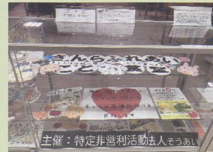
NPO法人 そうあい 主催：特定非営利活動法人そうあい