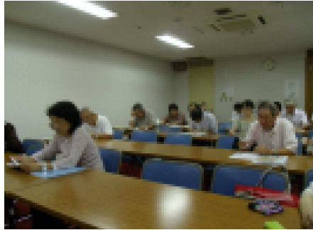
実行委員会の様子 (9月12日)

現在のとおり参加申し込み団体は54団体、62企画のほり、はやくも盛況の兆しを見せています。