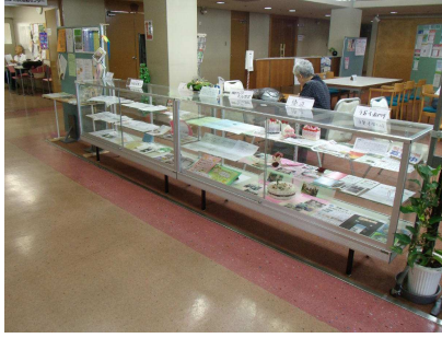
ガラスショーケース

市民会館4階の寝屋川市民活動センター、エレベーター前に会員団体の活動内容や手作り作品をガラスショーケースに納め来場者に自由に見ていただけるよう展示しています。 作品については即売もしていますのでおきがるに事務局までお越しください。 今回の展示は9月14日に参加申し込みを締め切り、新たに次の6団体が展示します。