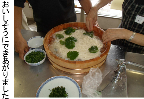
おいしそうにできあがりしました