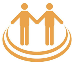
なかまのイメージ

「NPO 法人寝屋川市民活動ネット・なかま」は構成会員の大半が寝屋川市で活動中の市民団体や個人からなり、市民活動センターの管理運営をはじめとして、市民活動の促進と活動団体発展のための支援を大きな目的にしています。