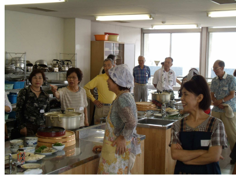
さあみんなで作りましょう!

総勢38名(男性13名女性25名)が参加し、お互いに協力し合いながらそうめんをゆがき、冷やして美味しくいただきました。