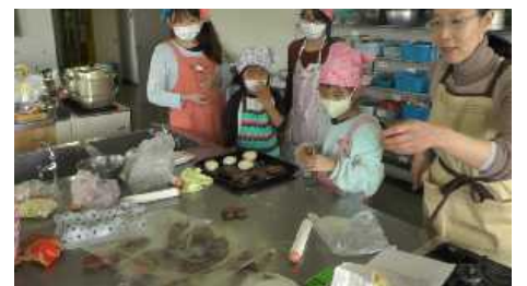
つばさパン教室・パン作り体験

ふれあいフェスタでも毎回好評な焼きたてパンを提供している「つばさパン教室」ではパンの製作にかかりつきりで踊りや演技を楽しみ、余裕がなかったといううれしい悲鳴を上げておられました。