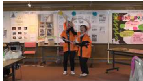
【南京玉すだれ】ハートで楽しく♪

会場ではコーヒー、紅茶の販売やおにぎり、お茶、焼きたてパンの販売もされました。お客様にはこれらの購入には事前に地域通貨ねやがわのコーナーから購入してもらった地域通貨「げんき」を使い、利用体験をしました。