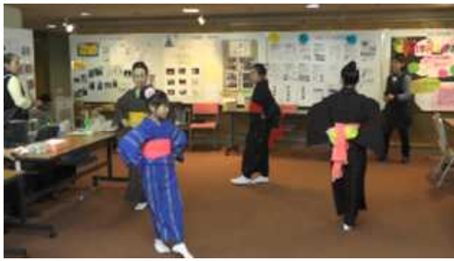
秀麗会の皆さんの【ご一緒音頭】

サロン中央では、「なでしこの会」の南京玉すだれ演技や「秀麗会」の踊り・ご一緒音頭を披露され、参加者の皆さんをなごませていました。