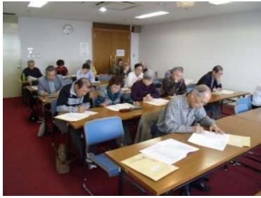
総会議事風景 多数の会員が参加

議事では報告案件 2 件、議事案件 3 件を異議無く承認・可決され総会は無事終了しました。