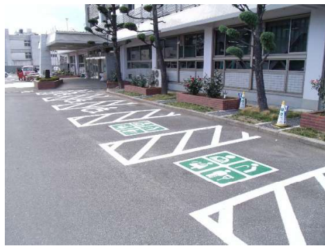
寝屋川市役所本庁前ゆずりあい駐車場

ダブルスペースの整備と併せて、知事が利用証を交付することにより、これらの区画に駐車できる対象者を明確にすることで、不適正な駐車 of 更なる抑制を目指すものです。