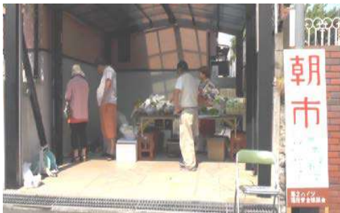
地域の役員さんの手作り看板で開店