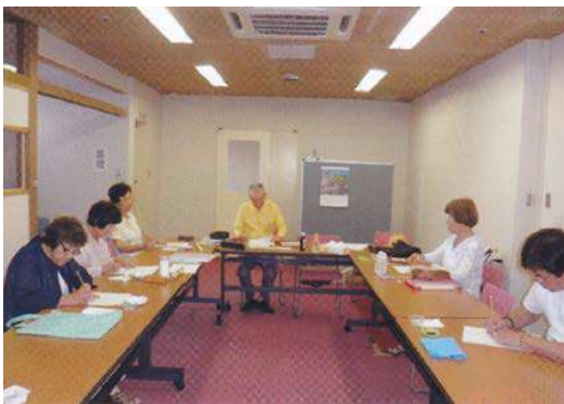
教室の様子 皆さん和気あいあいですが作業は真剣です