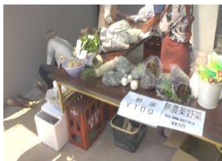
無農薬野菜は100円で販売

9時半頃にはほとんどの品が売り切れてしまい10時前には片付けにかかっていました。