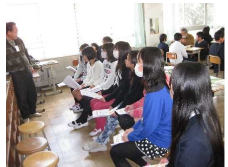
小学校での囲碁将棋の授業

年々3回のイベントは地域の企業や団体、神社等のご協力を得て開催しその運営は数多くのボランティアによって支えられています。 囲碁将棋を通じた明るい街づくり、一緒に活動して下さる方を募集中です。