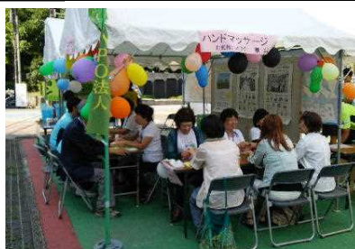
ハンドマッサージコーナー