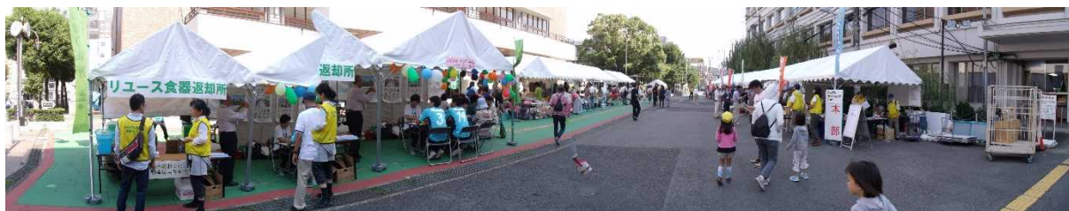
枚方市民会館前の広場にはテント村が作られました

まらなど園店周広市てNPO支はひ せてののや辺場駅い活援NPOはら せて多の野展で、場す動セ法人か いた加彩外示、す、の、の、か した参ス、即、の、の、の、た 了な、売、を、の、の、の、た 了な、売、を、の、の、の、た 了な、売、を、の、の、の、た 了な、売、を、の、の、の、た 了な、売、を、の、の、の、た