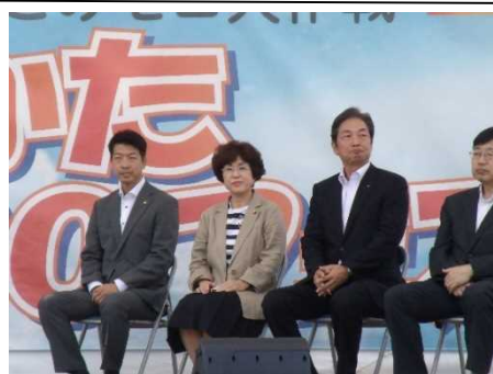
開会セレモニーには市長（左端）、市議会議員（左から二人目）も列席

体験などを通じて普段の活動を紹介し、行政や企業市民と交流する年に一度のイベントです。寝屋川市における寝屋川ふれあいフェスタと同じ良的で開催されるのでより良い寝屋川ふれあいフェスタにするためこれに参加し、運営方法や内容を見学しました。会場は立地も良く多くのお客さんや学生さんたちも参加されて活発に賑わっていました。