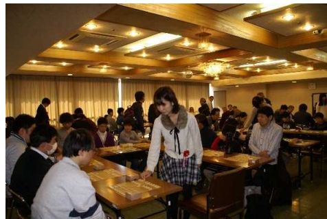
寝屋川囲碁将棋まつりでの女流プロによる指導将棋

盗られたバッグの中身は入院している家族の汚れた物だったため金額的にはたいしたことはなかったのですがガラスの修理費に数万円かかりました。 外から見える所に物を置かない 中身の価値のないものも車の外から見えないようにバッグ等を放置しないように