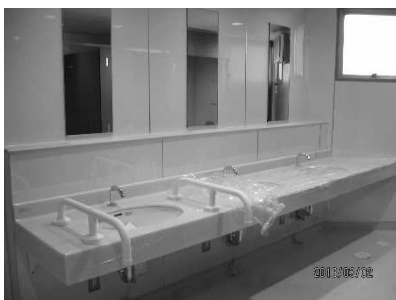
耐震補強工事に伴いトイレもきれいになりました

また、体育館や多目的体育室は子育て支援やイベントルームもわれわれ寝屋川市民には新鮮で勉強になりました。今後の市民活動センターの運営の方向性に変化参考になりました。