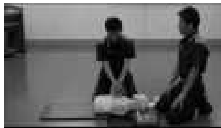
上半身だけの人体模型で練習 (イメージ)

AEDの貼る場所は、胸部と背骨の間に貼ります。胸部の貼る場所は、鎖骨の下、乳首の高さで、電極を胸に貼ります。背骨の貼る場所は、背骨に沿って貼ります。電極の貼る場所は、胸の中央、鎖骨の下、乳首の高さで、電極を胸に貼ります。