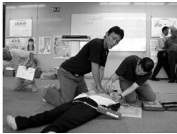
心臓マッサージ手法 (イメージ)

方名は「寝屋川消防組合」の20名が指導され、心肺蘇生法とAEDの使用法を学びました。倒れている人が呼吸を止めていると気づいたら、胸に手をのせて、胸を強く叩くように指導されました。乳首の高さまで、早急に対応してあげることが大切です。