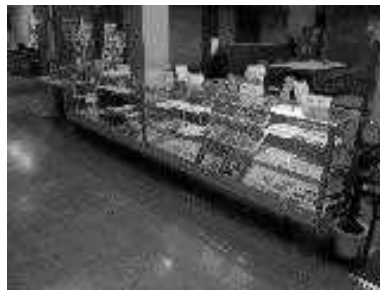
以前のガラスショーケース

月間となりますので展示を希望される団体は市民活動センター事務局までお申し込みください。