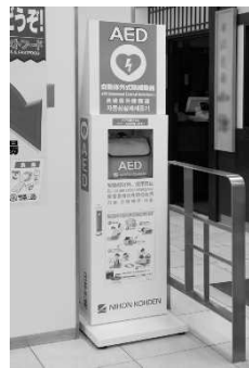
AEDの設置状況 (イメージ)

この時、救命を求め続ける人々のため、周囲の方の応援も求めらる。AEDの操作も、手順通りに進めると、スムーズに作業が進みます。AEDは、倒れた人の胸に貼られるので、探さなくても見つかる仕組みになっています。最近では、駅や学校、病院、商業施設などに設置されています。AEDの表示が、周囲の人に知らせることができるようになっています。