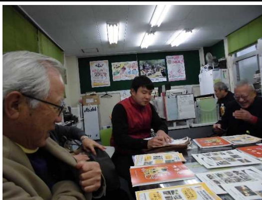
新福さんの説明を受ける推進委員

「（つどい）はみんなと仲良く、自分の好きな事、得意な事が、地域のため八尾のため、どんどんつながる事を目指しています」と元気一杯話されました。