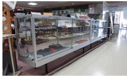
エレベーター前のショーケース

市民活動センターエレベーター前の展示ケースに4月から新たな団体が展示します。展示品の一部につきましては即売または別途注文も承っていますのでお気軽に市民活動センター事務局までお問い合わせ下さい。