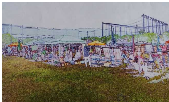
アートやつちやお風景（やお通信 25 号より）

又、団体事業として、昨年の事業に触れ、八尾市の環境施設組合のグラウンドを借り「やお市民活動まつりアート やつちやおう！」の開催、イベント・パフォーマンス・屋台・子どもの遊び場等を設定し、様々な活動団体との交流のほか、マイバッグ作成・時代仮装・動物とのふれあいや野菜直売な