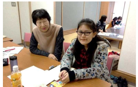
鶴丸先生としのはらさん

合格発表の当日、しのはらさんは発表を見に行き帰ってきました。ほっとフレンズの先生たちは心配で彼女に「合格したか？」 「受かったか？」