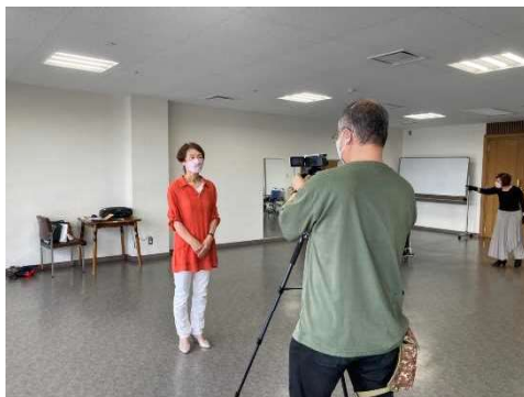
オープニング場面撮影中