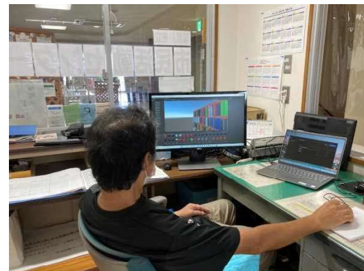
仮想空間の制作中