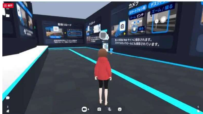
仮想展示スペースの例

仮想空間を作り、その中から従来のパネル展示が出来る仮想会場を新作して、参加団体からの展示作品の写真や動画を展示する予定です。