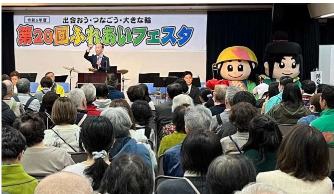
フェスタ開会式の様子

新年明けましておめでとうございませう。旧年は第20回ふれあいフェスタや市民活動講座など皆さまのご協力、ご尽力をいただき、多大な成果や手応えを得ることができました。海外ではウクライナやパレスチナでの停戦の見通しも立たない、また各地でいくつもの紛争や分断の火種が絶えない状況下にあります。国内でも政情不安定ななかで、気候変動、大災害、少子高齢化など山積みの問題に私たちは向き合っていかなければなりません。そんな中で、私たちはコロナ禍に対してもオンラインでの取り組み、ハイブリッドな新たなあり方の模索などを経て乗り越え、20周年のフェスタにも世代をつなぎ、課題をつなぎ、千人を超える参加者を実現して、新しい地歩を踏み出してきました。この1年も大変に厳しい状況での市民活動となるかと思いますが、この数年で皆様と一緒に切りひらいてきた力を更に発揮