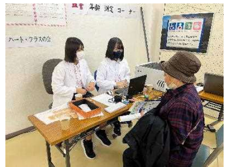
フェスタでの中学生ボランティア

させてゆくことで課題の解決にも力強く向かってゆけるものと確信しています。何卒、この1年も昨年以上に充実した年になりますように、共に歩んでいきたいと思えます。宜しくお願い致します。