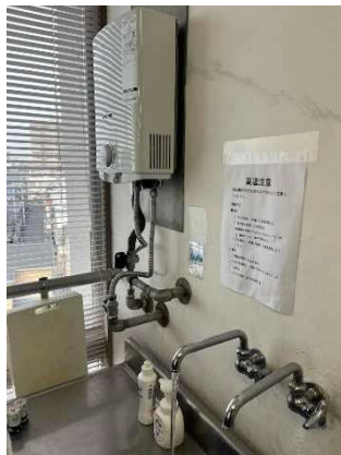
新しくなった給湯器