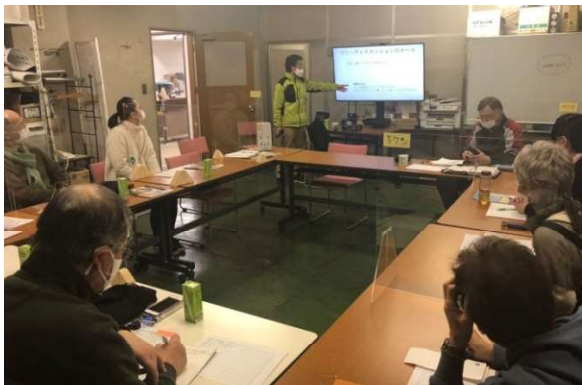
新しい意見も飛び交った「第1回準備委員会」 ＝センター運営委員会室

まずは「ふれあいフェスタ準備委員会」を設置し、2月26日に第1回委員会を開きました。