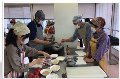
昨年11月に開かれた「漬け物づくり体験講座」の様子

打上川治水緑地の魅力向上と利用活性化を目指し、打上川治水緑地について考えてくれる人を対象にワークショップ(全4回)を開きます。