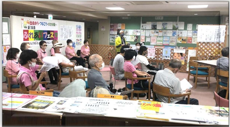
昨年の「ふれあいフェスタ」＝4階交流サロン リモート発表・リモート会議などを体験。今年は「メ タバース」体験？！

今年も活動集大成の発表の場「ふれあいフェスタ」を従来の形に加え一歩二歩進化させ、登録団体の皆さんとつくりあげたいと思っています。(智)