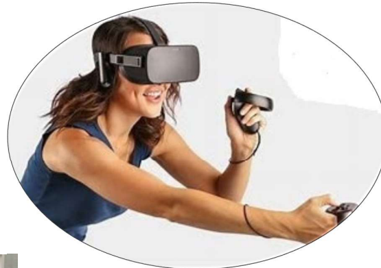
メタバース体験イメージ画像