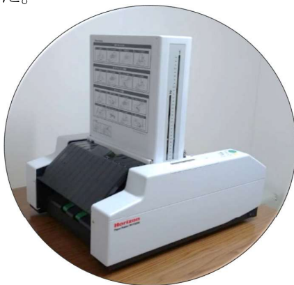
大好評!! 全自動の紙折り機

利用者の皆さんから「今までは、調節が微妙で思うようにいかないこともありましたが、新しくなってからはスムーズに作業できて喜んでいきます。大切に使いしていきたいと思えます」とのメッセージが寄せられました。