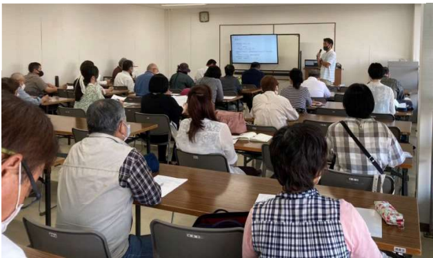
画像を用いて説明する担当者と視聴する実行委員