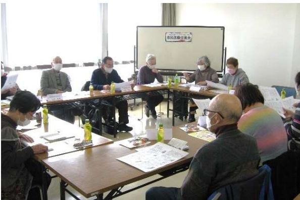
ぬくもりのある「おもしろい」が語られる交流会