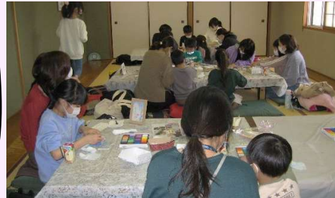
どの色を使うかな～作品に取りくみ中