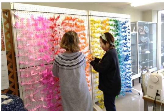
フリースペースに飾られた折り鶴。訪れる人の目を楽しませています