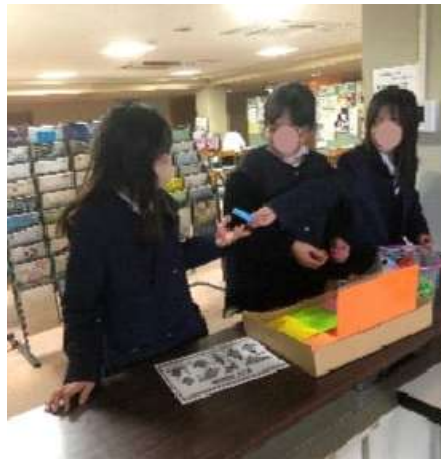
折り鶴に挑戦中の中学生フリースペースで