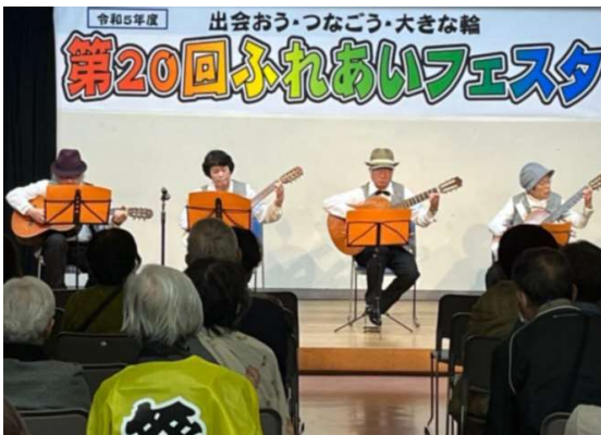
小ホールではギター演奏=舞台発表(第20回)