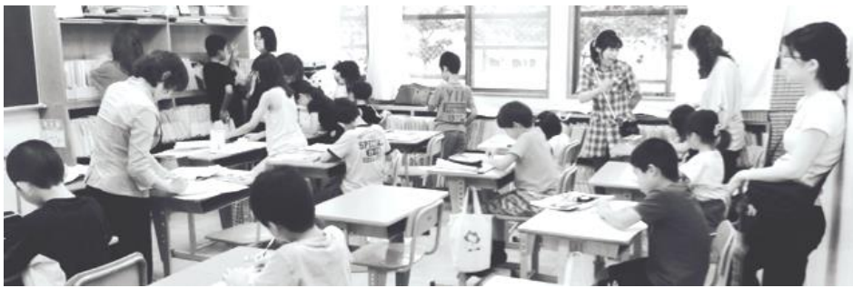
プリントに挑戦中の 小中学生 = 友呂中 学校