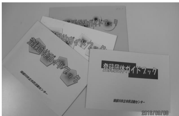
過去4冊の「登録団体ガイドブック」色も緑→桃→黄→青・・・と変化