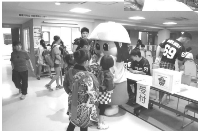
← 「熊本県九州地方地震」の支援募金箱も設置 特別参加のヒロインはちかづきちゃんもちびつと楽しいふれあい＝4階受付前