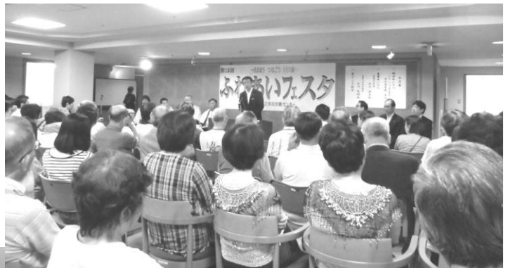
↑ 市長を迎えての開会式。会場は参加者でいっぱいになりました＝4階メイン会場

7月9日、市立市民会館4階と1階で第13回「ふれあいフェスタ」を開きました。例年秋の開催ですが、当館耐震工事のため、この時期になりました。(2面に関連記事)