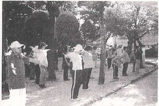
深緑に囲まれた公園で、朝一番のさわやかな空気を胸一杯に体操を楽しむ皆さん=9月17日