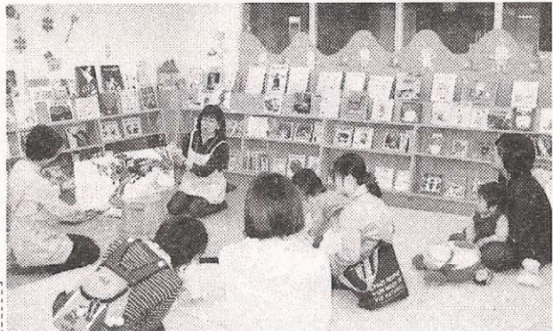
子ども達に絵本を読むスタッフ