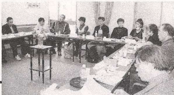
各団体の情報交換や環境問題について話し合われた = 3月12日、交流会会場で