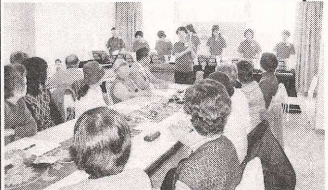
音楽集団「楽」による認知症予防のための体験教室