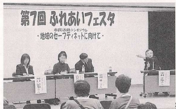
今回初の取り組み「市民活動シンポジウム～地域のセーフティネットに向けて～」ではパネリスト、会場が一つになって、熱い意見が交換されました＝1階小ホールで