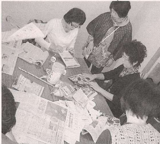
古新聞を使って、手提げ袋づくりを体験 「丈夫な袋ができて、驚きです」と参加者

恒例になった寝屋川市民活動センター主催の「ふれあいフェスタ」が11月6日(土)に市立市民会館で開かれます。テーマは今回も「出会おう つなごう 大きな輪」とし、たくさんの市民がつどい、発信し受信しあえる場としてメニューも盛りだくさんです。(2面に関連記事)