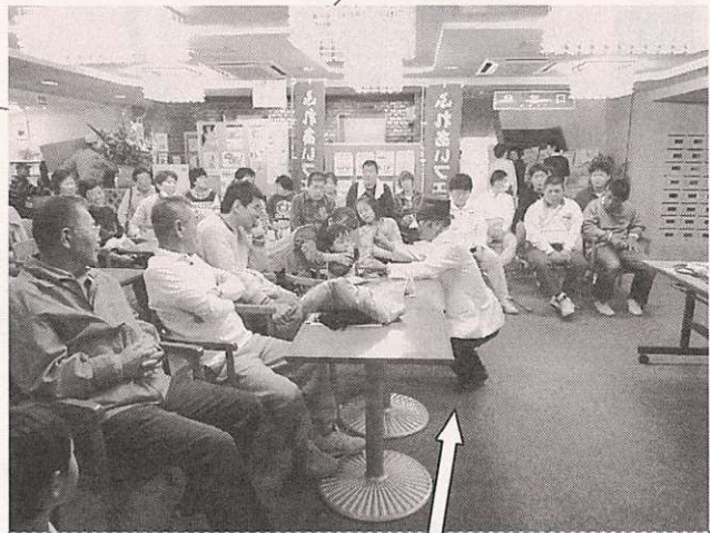
マジック路披露では、マジシャンが観客席まで出向いての熱演。「ん～、すご～い!!」

市民活動センターに登録の40をこえる団体が、日ごろの活動の成果を発表、情報交換とおして交流を深めることのできる場です。