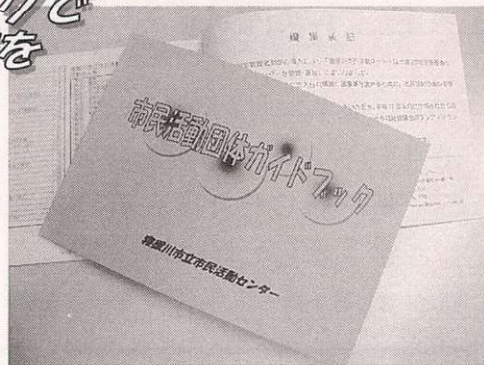
前回(平成21年3月)発刊の「市民活動団体ガイドブック」

新刊に向けて更新・新規登録の書類をお送りしますのでご協力のほどよろしくお願ひします。