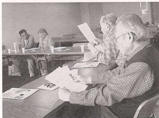
活動や日ごろの思いについて語り合う参加者のみなさん

毎月「市民活動交流会」を開いています。これは市民活動センター取り組み事業の一つで、どなたでも参加可。情報交換などをおし交流を深めることのできる会です。今回は12月9日に話し合われた内容をご紹介します。