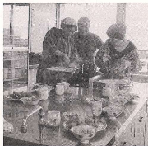
「採れたての新鮮野菜で作る料理は最高！」調理実習中の会員