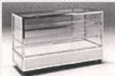
ケース ほぼ同型の ショウ