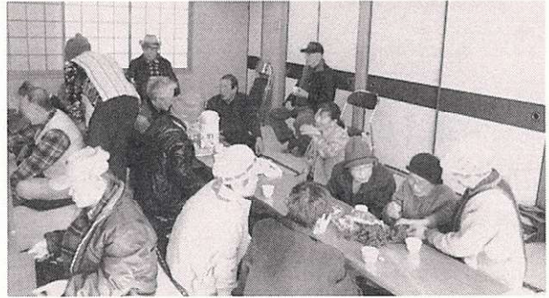
ふれあいの場でくつろぐ「見守り会・一声会」のみなさん