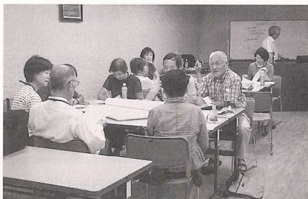
グループ討議。参加者がテーマに沿って思い思いの意見を出し合いました＝市民会館研修室

市民活動に関わるときに必要な情報処理の手法などの実例をとおして語り合い考える場として設定されました。参加者：21人