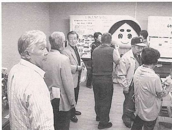
←今回は寝屋川市のマスコットキャラクター「はちかづきちゃん」も参加。会場のあちこちに顔を出して(?)いました。