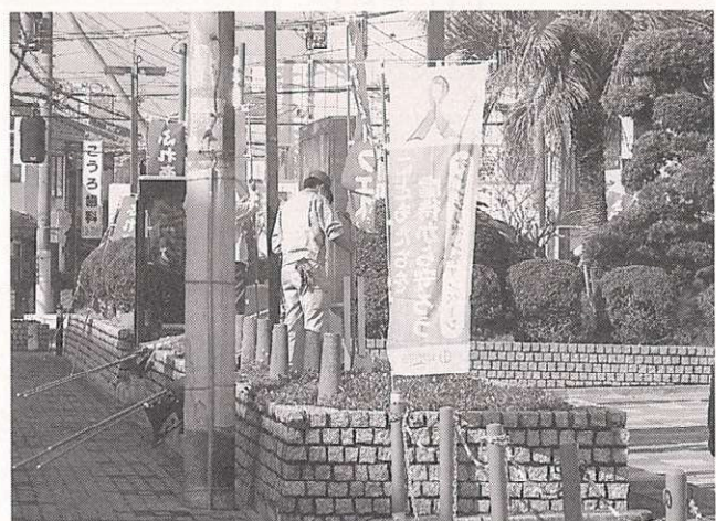
↑前日の準備もバッチリ。会場の市民会館前に「ふれあいフェスタ」ののぼりも立てられました