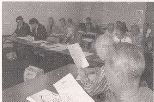
会員が集まって開かれた前回(平成23年度)の総会