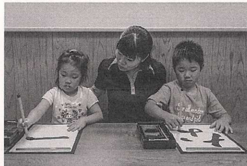
ふたりとも真剣なまなざし で取り組んでいます