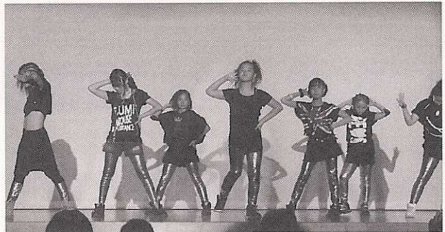
舞台いっぱい元気なダンスを披露するメンバー