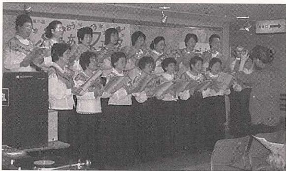
コーラスの発表=きれいな歌声が会場に響いて.....