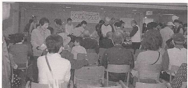
(いずれも前回の写真)