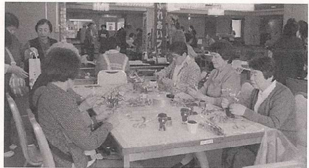
↑ フラワーアレンジメントを楽しむ参加者 「ん~思ったよりうまく生けることができました。食卓に飾ります」=50代女性

また、今回は4階のメイン会場に加えて、ピロティでもコーラス、演芸、小学生の踊りや子どもの遊びコーナー、食べ物コーナーなどお楽しみも倍増のフェスタをめざしています。