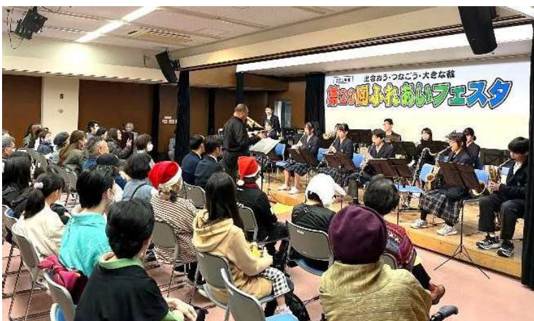
開会式にふさわしく力強い演奏を披露する第一中学校吹奏楽部のみなさん＝前回(第20回の様子)小ホールで

今回も開会式では市立第一中学校吹奏楽部の皆さんによる演奏が予定され、続いては4階全体、2階第一会議室、3階図書館など各所で展示、セミナー、舞台発表が繰り広げられます。